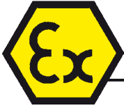
Tabla de selección Accesorios para el escáner manual de códigos de barras BCS 160 ex